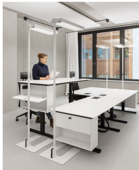
NGO · Berlin · m-pur-habitat